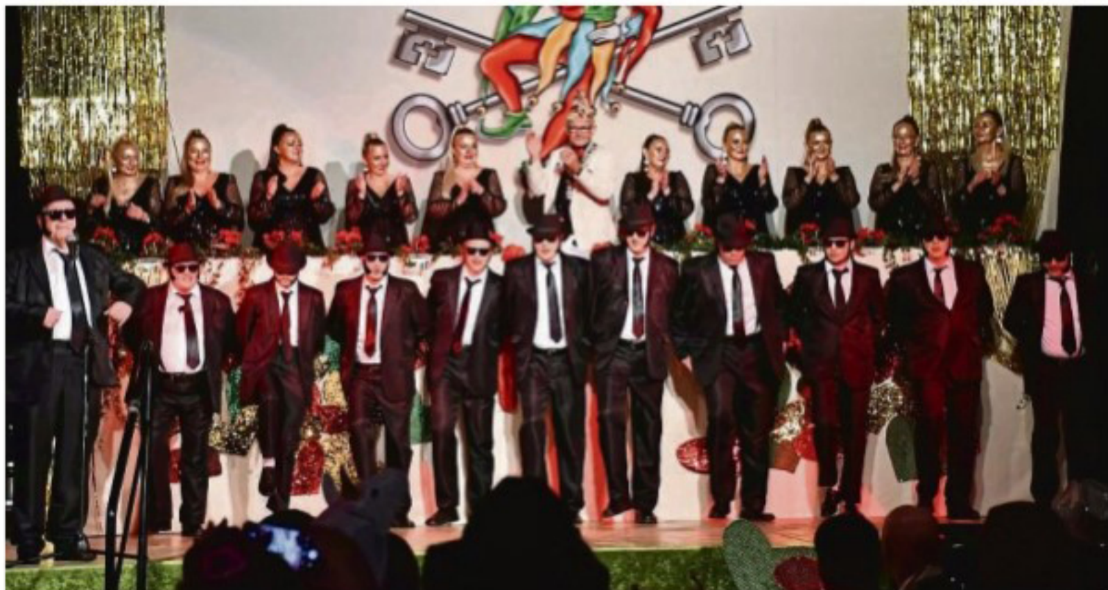
„Es ist dunkel und wir tragen Sonnenbrillen...“ Keine Frage, die Blues Brothers statten der Gala-Sitzung im Bürgerhaus einen Besuch ab. Da können die Elfen nach der „Machtübergabe“ den Elfern nur noch brav applaudieren.