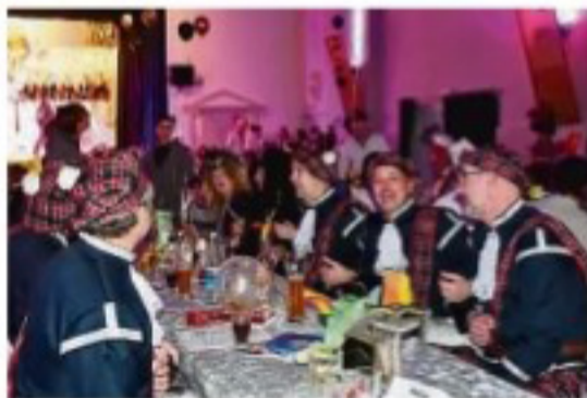
Erfreuen die (schottischen) Narrenherzen: Die Röchler mit einem Potpourri aus der Hitparade und die Bürgeler Tanzsportlerinnen.